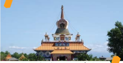
द ग्रेट लोटस स्तुपा, जर्मनी