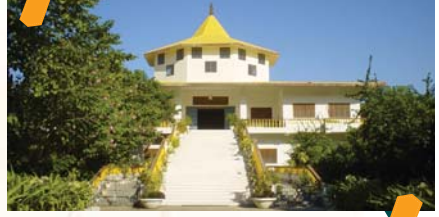
महाबोधी समाज विहार, कलकता