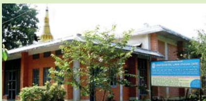
धर्म जननी ध्यानकेन्द्र