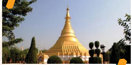
म्यानमार गोल्डेन स्तुपा तथा विहार (म्यानमार)