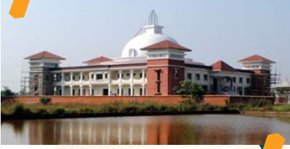
यूनाइटेड टुंगग्राम विहार, नेपाल