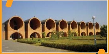
लुम्बिनी अन्तर्राष्ट्रिय अनुसन्धान संस्था