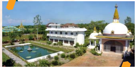
अन्तर्राष्ट्रिय भिक्षुणी विहार, नेपाल