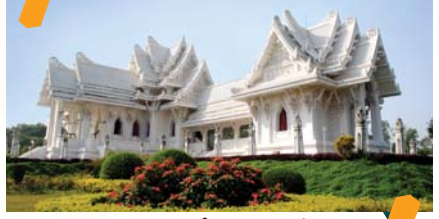
राजकीय थाई विहार (थाइलेण्ड)