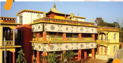
इबक्युड छोलिङ विहार, नेपाल